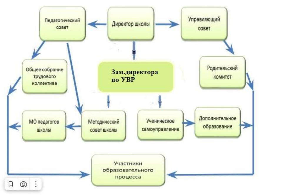
Структура и органы управления образовательной организацией